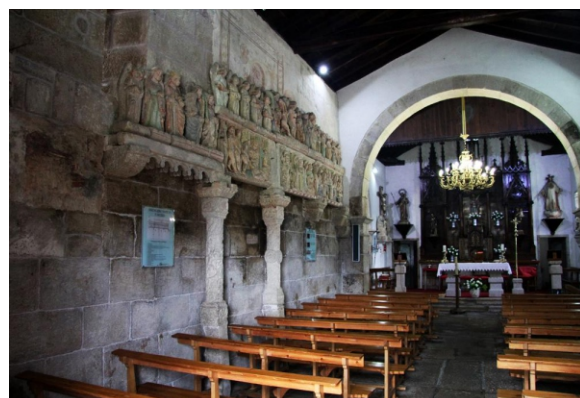
Igrexa de Ventosa