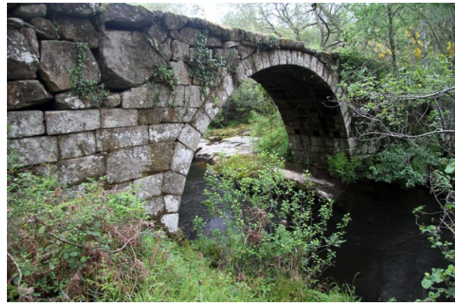
A Ponte dos Cabalos, sobre o río Arnego foi construída no ano 970. É a única que queda das 6 pontes medievais que enlazaban a comarca do Deza con Antas de Ulla. Por ela pasaba o camiño real e actualmente forma parte do percorrido do Camiño de Inverno da ruta xacobeá cara a Santiago. Tivo especial importancia nas guerras carlistas.

Se queremos ampliar a camiñada podemos seguir río arriba ata unha ínsua onde hai unhas tostas ou atrancos para muíños.